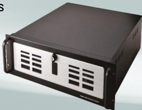
4CH.HD-SDIビデオレコーダー NS-1204HDS