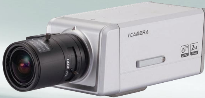
写真 メガピクセルレンズ(別売)装着